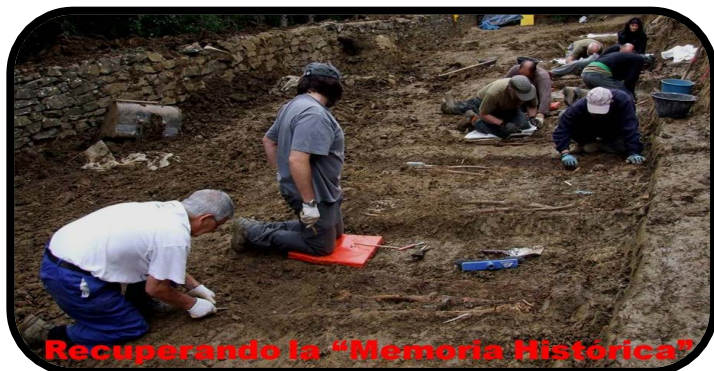
Recuperando la “Memoria Histórica”

También en plena JUVENTUD, a los 20 años, se nos obligaba a hacer “El Servicio Militar” y durante veinte meses nos entrenaban para estar preparados en la defensa de la Patria. Pero lo que de verdad pretendían era hacer un control de las personas; para conocer si nuestras ideas eran afines o contrarias al Régimen.