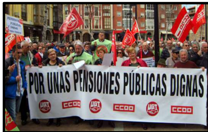
Concentración Torrelavega 15 Marzo