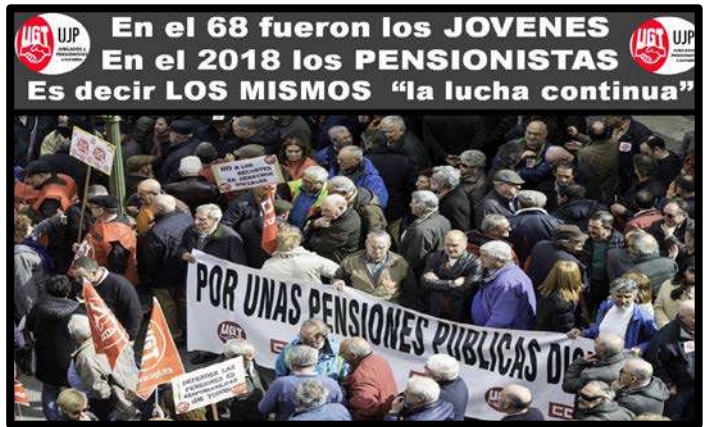
Concentración en el INSS 1 Marzo 2018