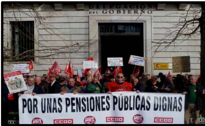
Concentración D. Gobierno 15 Feb. 2018