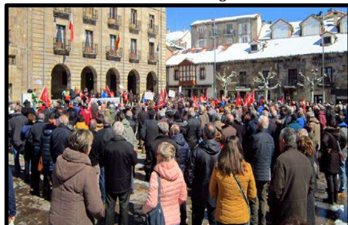
Concentración en Reinosa 12 de Marzo