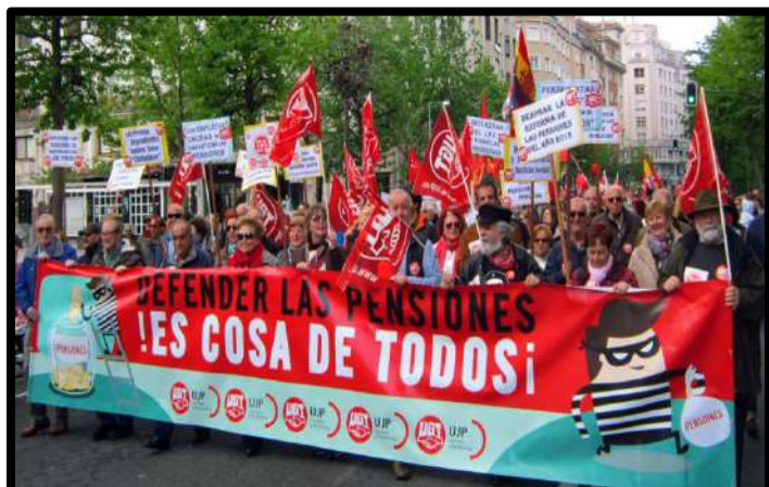
Manifestación Santander 1º Mayo 2018