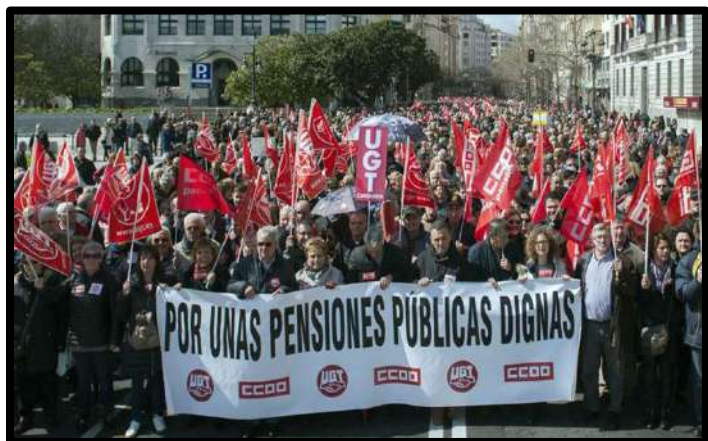
Manifestación Santander 17 Marzo