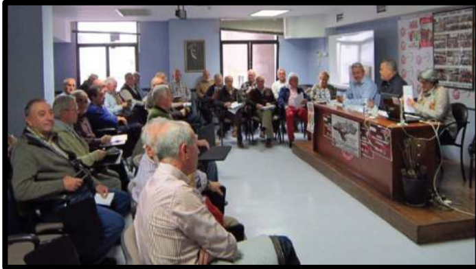
Comité Regional UJP 22 Noviembre 2017