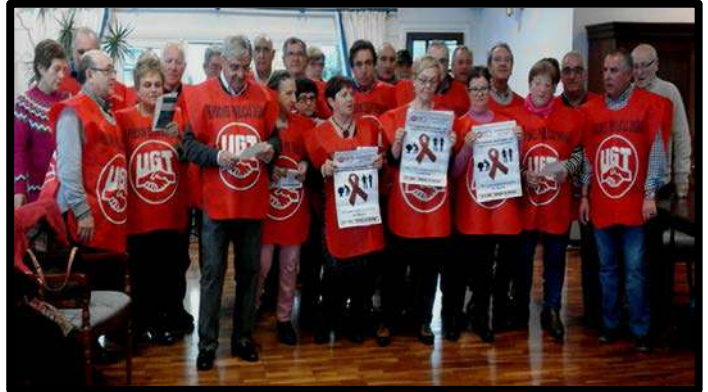
Grabando "El Pensionista Cabreado" 26 enero