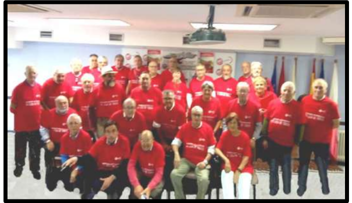
Comité Regional de UJP 20 Septiembre