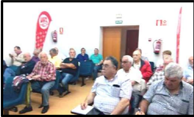
Comité de UJP en Torrelavega 15 Junio