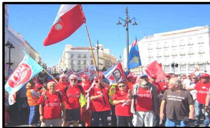
Manifestación Estatal en Madrid: 9 Octubre