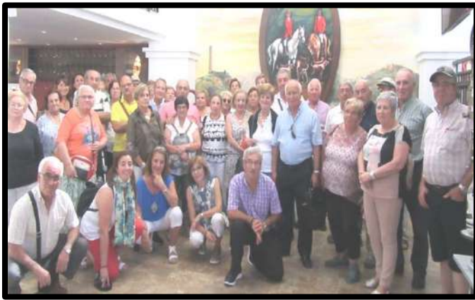
Viaje a Andalucía: 23-29 de Septiembre