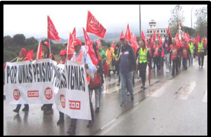
Marcha Santoña-Laredo: 30 Septiembre