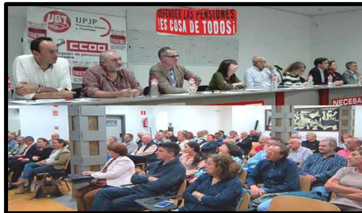
Debate "Pensiones" Santander: 27 Octubre