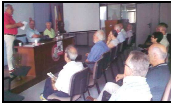
Charla: Inicios del Sindicalismo 21 Junio